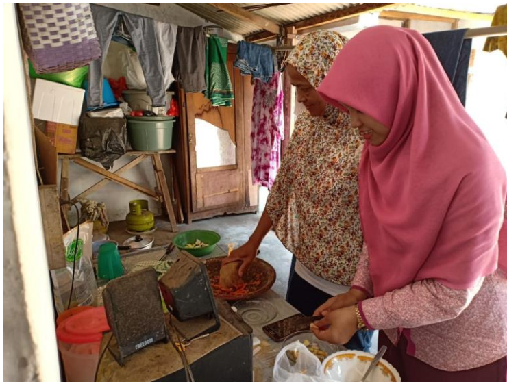
Gambar 5 Konselor mendampingi memmbuat menu DM sekali makan