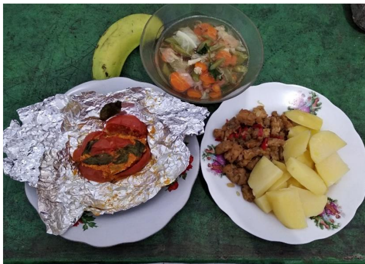
Gambar 12 Menu DM sekali makan