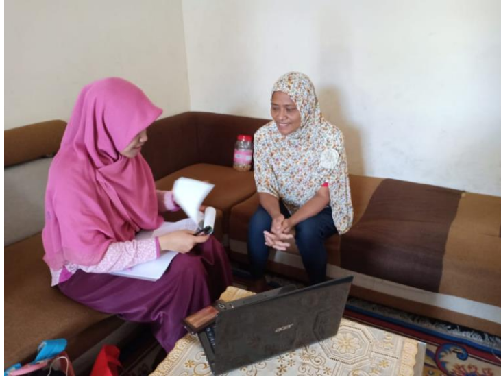
Gambar 4 Konselor memberikan konseling gizi intensif selama 50 menit