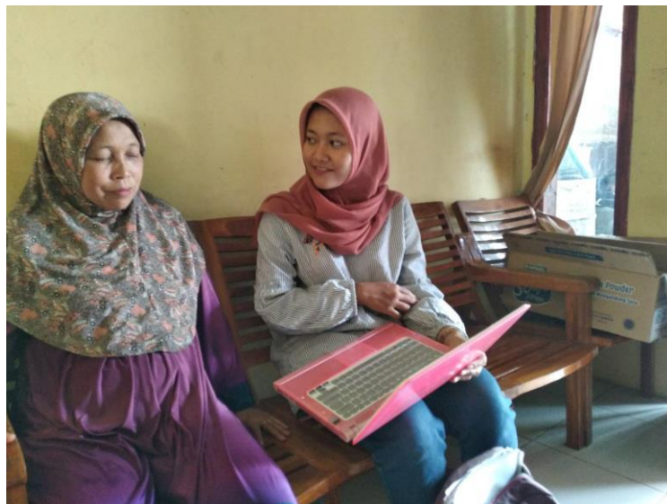
Gambar 6 Konselor memberikan konseling gizi intensif selama 50 menit