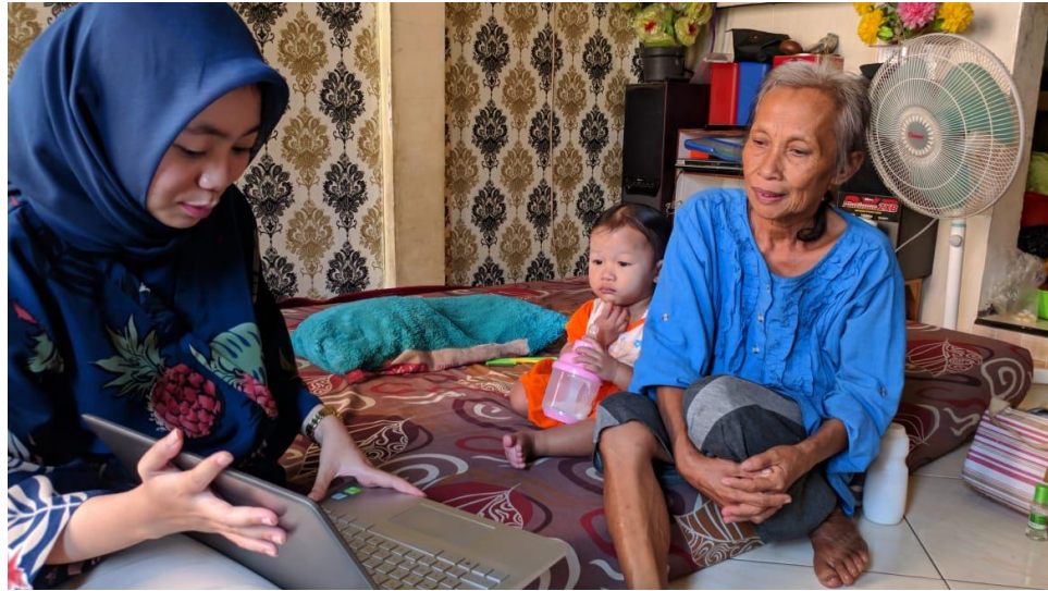
Gambar 16 Konselor memberikan konseling gizi intensif selama 50 menit