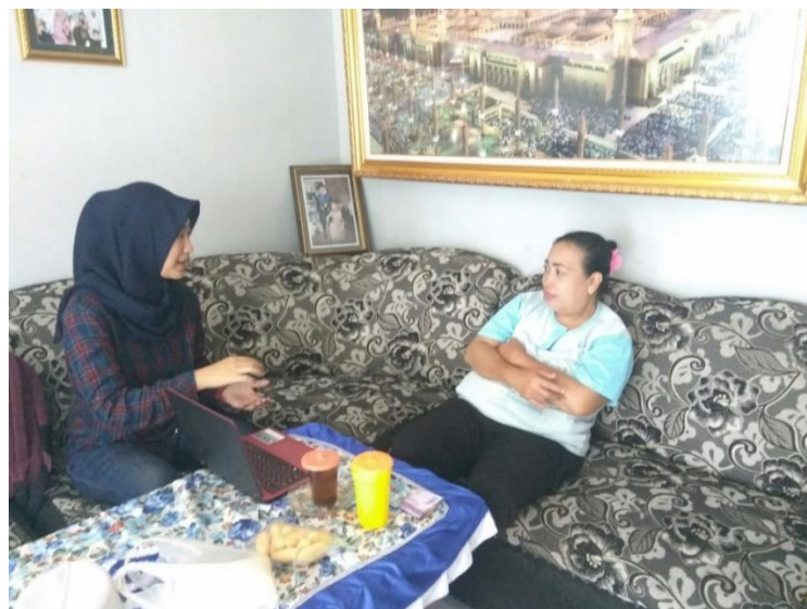
Gambar 9 Konselor memberikan konseling gizi intensif selama 50 menit