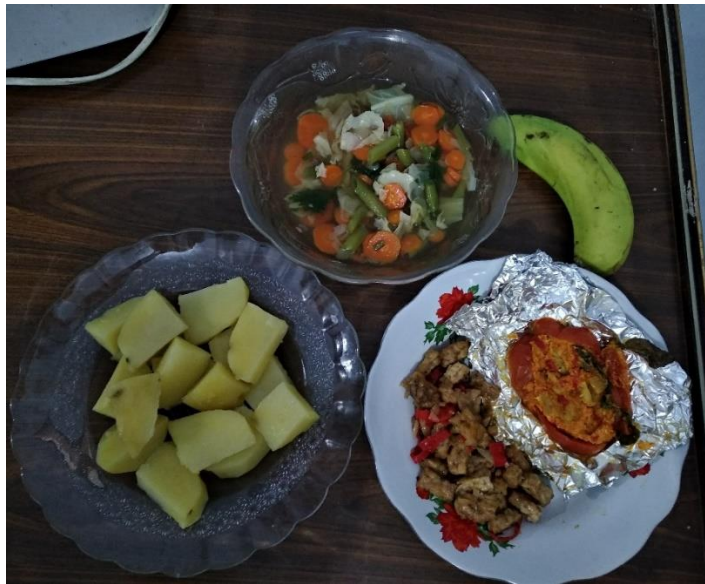
Gambar 11 Menu DM sekali makan