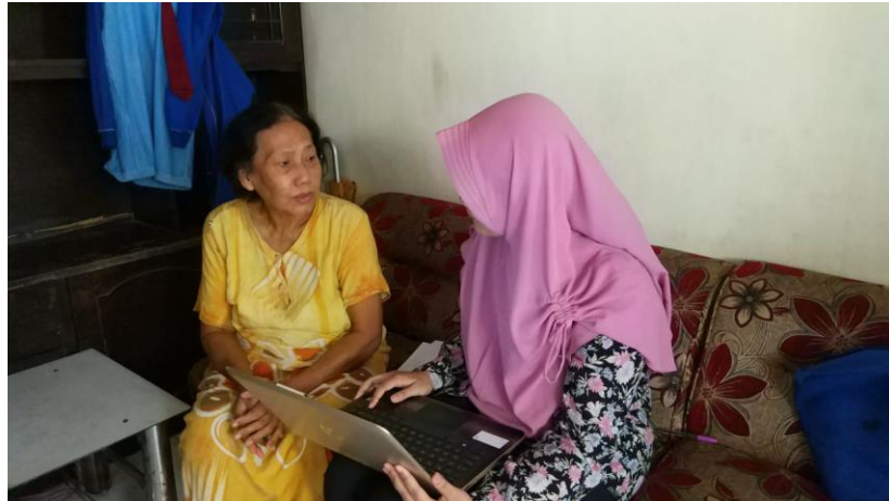
Gambar 13 Konselor memberikan konseling gizi intensif selama 50 menit