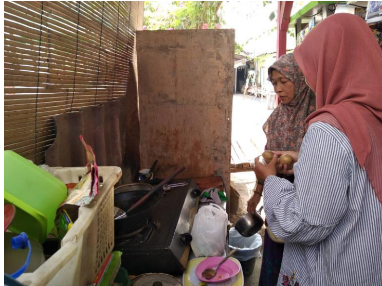
Gambar 7 Konselor mendampingi memmbuat menu DM sekali makan