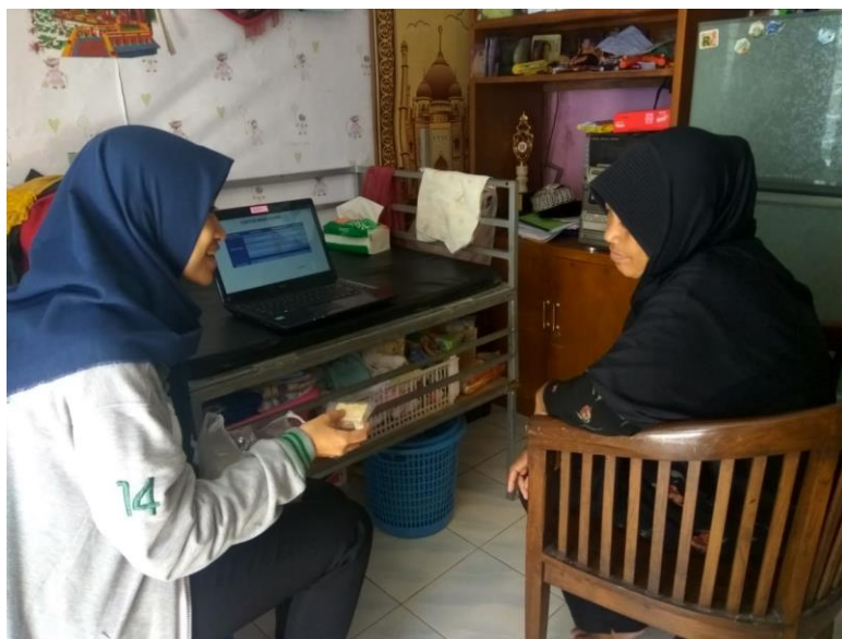
Gambar 18 Konselor memberikan konseling gizi intensif selama 50 menit