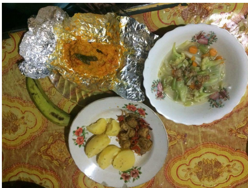
Gambar 15 Menu DM sekali makan