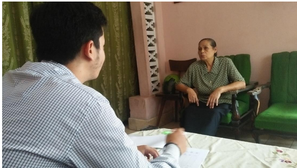
Gambar 17 Konselor memberikan konseling gizi intensif selama 50 menit