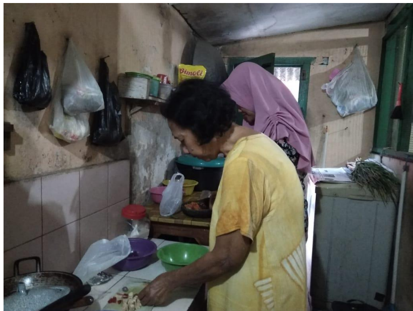
Gambar 14 Konselor mendampingi memmbuat menu DM sekali makan