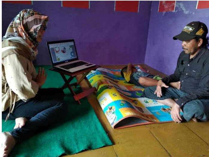
Gambar 10 Konselor memberikan konseling gizi intensif selama 50 menit