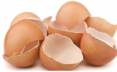
Gambar 2.2 Cangkang Telur Ayam

Cangkang telur memiliki sifat yang mendukung untuk menjadi adsorben yang baik, seperti struktur pori, \text{CaCO}_3 dan protein asam mukopolisakarida memiliki gugus aktif karboksil, amina dan sulfat (Surasen, 2002). Serat-serat protein dan kalsit berbentuk kalsium karbonat pada cangkang telur saling berikatan dan membentuk lapisan spons dan mammillary , yang pada akhirnya membentuk pori bagi cangkang telur (Carvalho dkk, 2011 dalam Maslahat dkk, 2015). Terdapat 7000 – 17.000 pori pada permukaan cangkang telur sehingga adsorbat dapat terperap di dalam pori tersebut (Stadelman, 1995 dalam Salman, 2012). Selain itu, cangkang telur mengandung \text{CaCO}_3 dalam jumlah yang banyak, yaitu 98,43%; dengan mineral lain yang terdapat dalam cangkang telur yaitu \text{MgCO}_3 (0,84%) dan \text{Ca}_3(\text{PO}_4)_2 (Jamila, 2014). \text{CaCO}_3 merupakan komponen polar sehingga cangkang telur dapat menjadi adsorben polar dan \text{CaO} memiliki struktur yang heksagonal dan memiliki kisi-kisi di dalamnya yang dapat diisi oleh ion \text{H}^+ , \text{Na}^+ , dan lain-lain (Khopkar, 2000) .