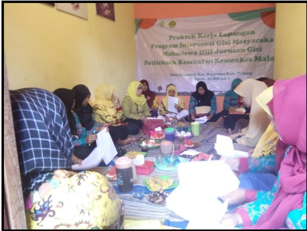
Mengisi kuisisioner pengetahuan dan sikap