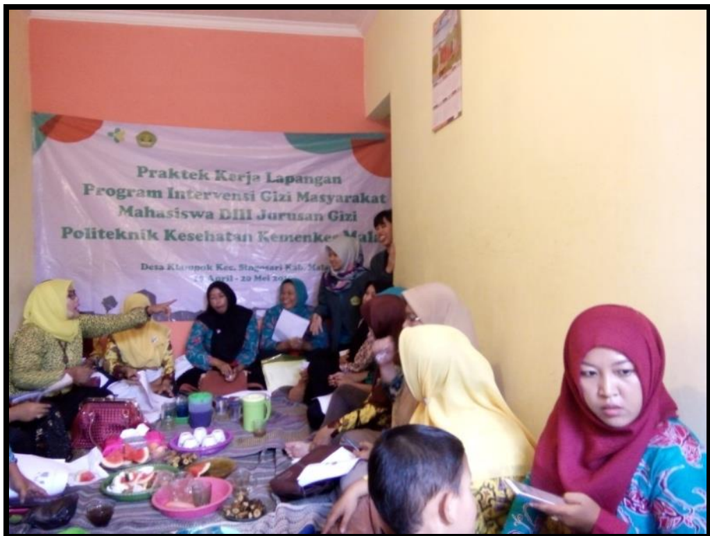
Tanya jawab materi UP GK