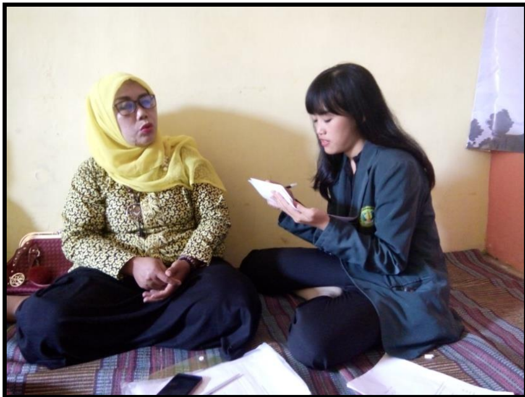
Wawancara keterampilan kader