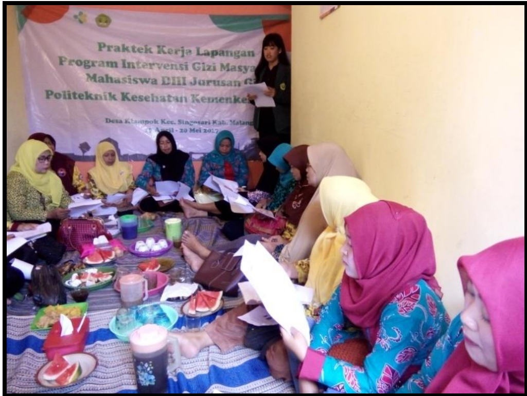
Pemberian materi UP GK