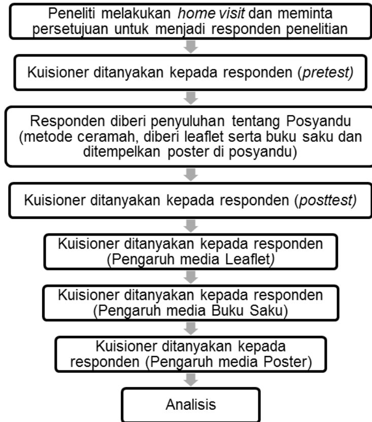
Gambar 3. Alur Pengumpulan Data