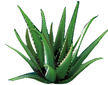
Gambar 2.1 Lidah Buaya

Kingdom : Plantae Divisi : Angiospermae Bangsa : monocotyledoneae Bangsa : Liliales Suku : Liliaceae Marga : Aloe Jenis : Aloe vera