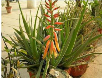
Gambar 2.1 Lidah Buaya.