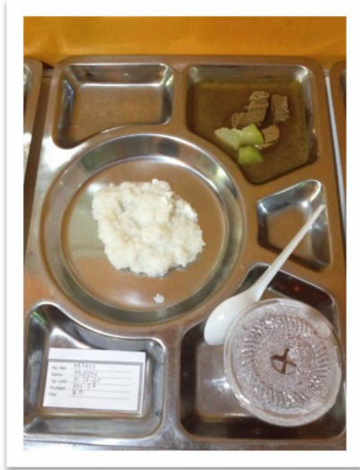
Gambar 4. Menu makan pagi pada siklus ke 2