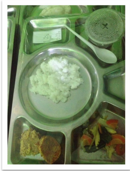
Gambar 12. Menu makan malam pada siklus ke 4