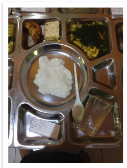
Gambar 10. Menu makan pagi pada siklus ke 4 Gambar 11. Menu makan siang pada siklus ke 4