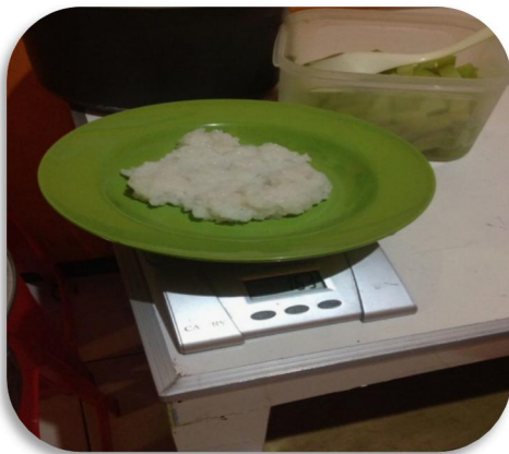
Gambar 3. Penimbangan Makanan