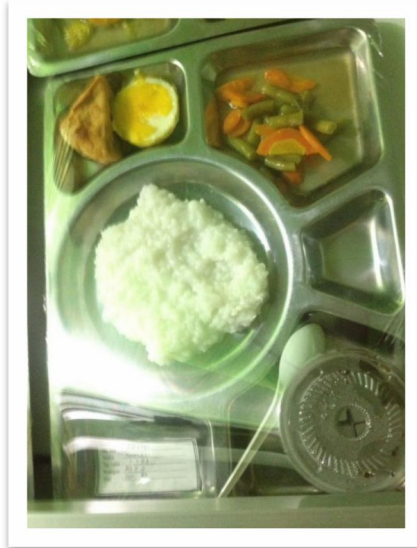
Gambar 8. Menu makan siang pada siklus ke 3 Gambar 9. Menu makan malam pada siklus ke 3