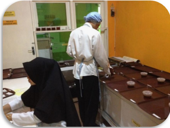
Gambar 1. Ruang Distribusi