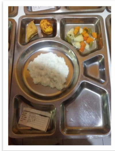
Gambar 5. Menu makan siang pada siklus ke 2