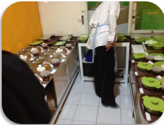
Gambar 2. Proses Pemorsian