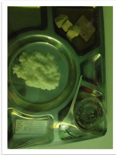
Gambar 7. Menu makan pagi pada siklus ke 3