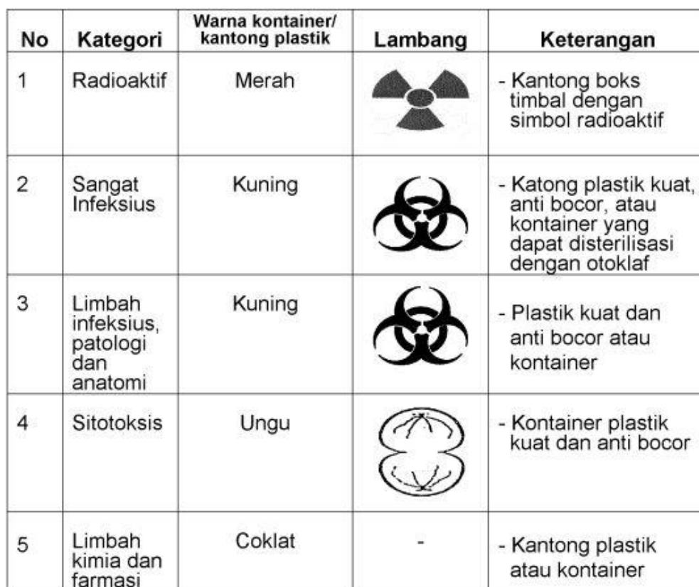
Gambar 2.4 Penggolongan Warna Tempat Sampah Medis

Digunakan sebagai wadah untuk limbah farmasi, yang dimaksud dengan limbah farmasi yaitu obat-obatan yang telah kadaluarsa.