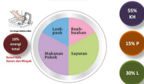
Gambar2: Porsi Makanan untuk Memenuhi Jumlah Zat Gizi yang Dibutuhkan Tubuh