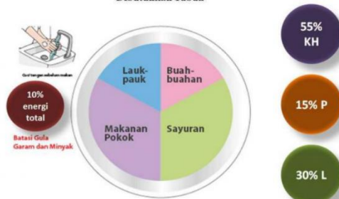
Gambar2: Porsi Makanan untuk Memenuhi Jumlah Zat Gizi yang Dibutuhkan Tubuh