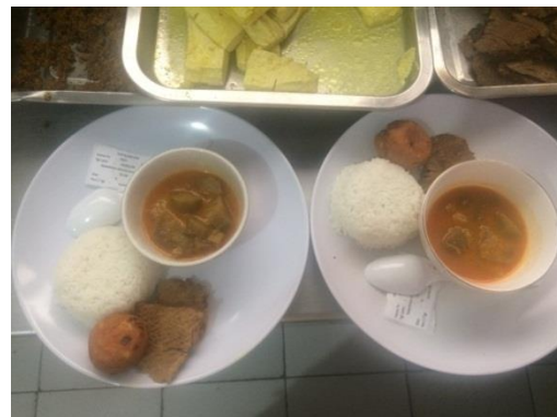
Gambar 14. Menu makan siang hari ke-10 (nasi, semur daging, bakwan tahu goreng dan terong balado)