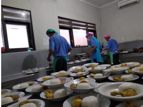
Gambar 7. Proses Pemorsian makan siang oleh Petugas Pemorsian di Ruang Pemorsian