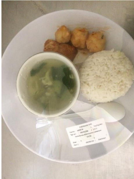
Gambar 15. Menu makan siang siklus ke-10 (nasi, bola-bola ikan dori goreng, tahu balado dan sup)