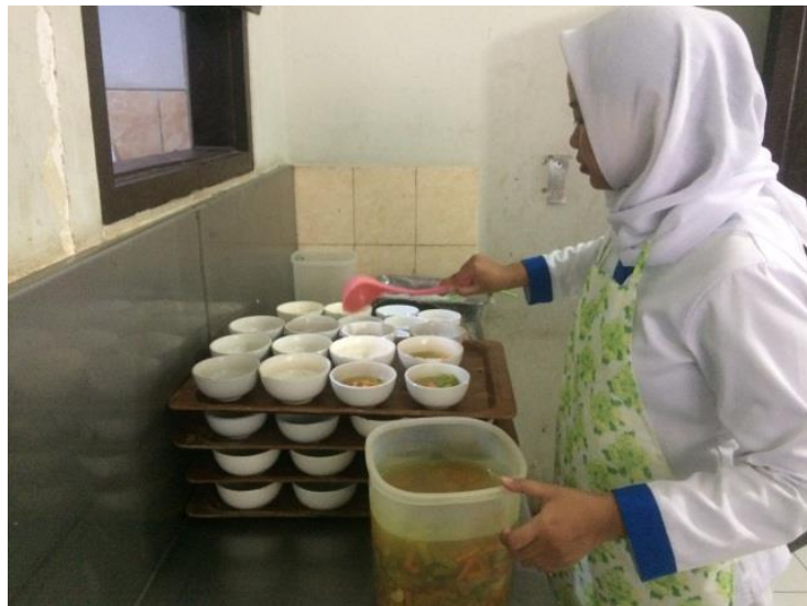
Gambar 17. Proses pemorsian sayur lodeh menu makan siang siklus ke-5