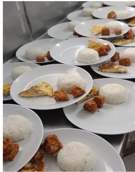
Gambar 12. Proses pemorsian menu makan pagi hari ke-6 (nasi, telur bumbu asam manis dan tempe balado)