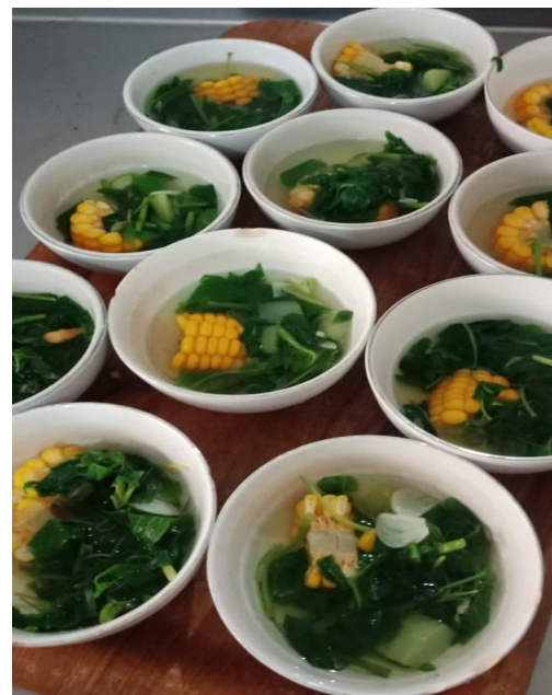
Gambar 10. Sayur bening menu makan siang hari ke-1, berat bayam 20 gram dan jagung 20 gram