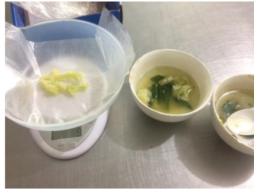
Gambar 8. Proses penimbangan sayur kembang kol (15 gram) menu makan malam hari ke 10