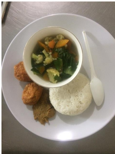
Gambar 13. Menu makan siang siklus kedua (nasi, daging sapi tumis saus bawang, bakwan tahu goreng dan cah sayur)