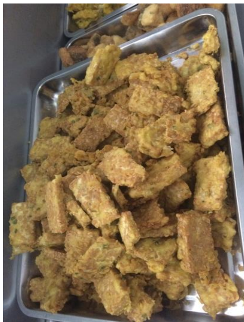
Gambar 9. Tempe goreng tepung menu makan ke 8 berat 50 gram per porsi siap diporsikan di ruang pemorsian