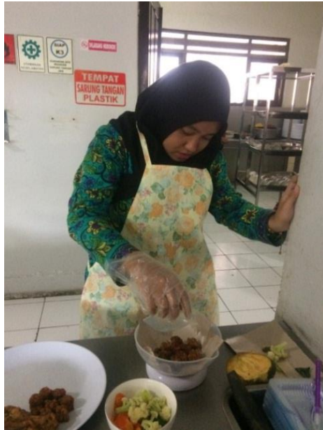
Gambar 11. Proses Penimbangan orek tempe menu makan malam hari ke-9 berat 32 gram