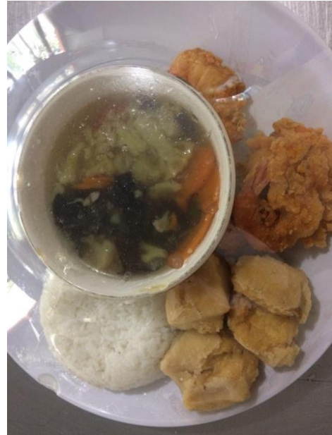
Gambar 16. Menu makan siang hari ke-8 (nasi, gurame goreng bumbu acar, tahu goreng dan tumis sayur pelangi)