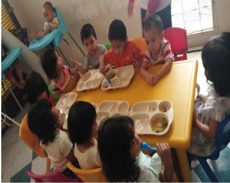
Suasana makan siang anak Arjuna Daycare Jl. Raya Langsep