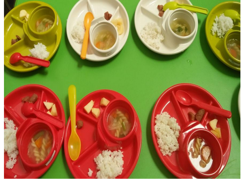
Porsi makan siang anak usia 12-36 bulan Arjuna Daycare