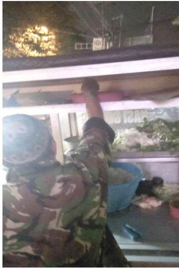
Gambar 5. Penjamah Makanan Mengambil Makanan Makang pada Nasi Goreng Makmur