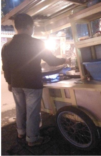
Gambar 10. Penjamah Makanan di Nasi Goreng Jaya Tidak Menggunakan Celemek dan Penutup Kepala