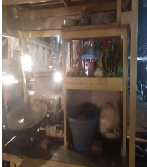
Gambar 11. Tempat Pengolahan dan Penyimpanan di Nasi Goreng Abadi