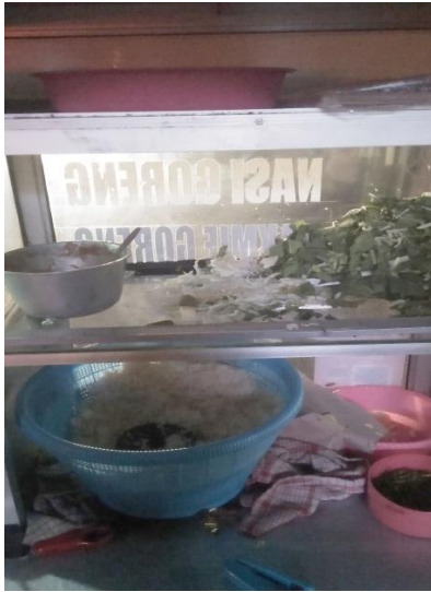
Gambar 4. Tempat Penyimpanan Bahan Makanan Mentah dan Matang pada Nasi Goreng Makmur