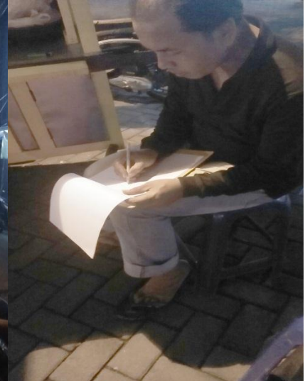
Gambar 12. Pengisian Kuesioner oleh Penjamah Makanan di Nasi Goreng Abadi