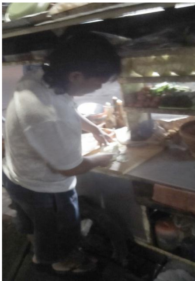
Gambar 13. Penjamah Makanan di Nasi Goreng Sejahtera Tidak Menggunakan Celemek dan Penutup Kepala