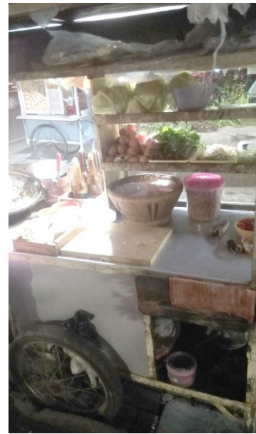
Gambar 9. Bahan Makanan Matang Disimpan Bersama Bahan Makanan Mentah pada Nasi Goreng Sejahtera