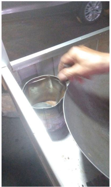
Gambar 8. Tempat Penyimpanan Air pada Nasi Goreng Makmur