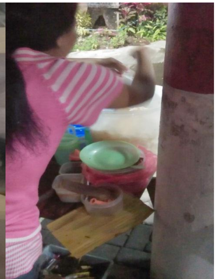
Gambar 15. Penjamah Makanan di Nasi Goreng Sejahtera Mengambil Kerupuk dengan Tangan Langsung