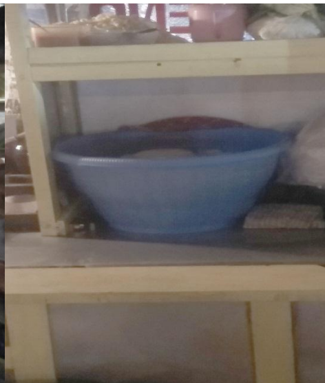
Gambar 14. Makanan Matang Tidak Ditutup di Nasi Goreng Abadi