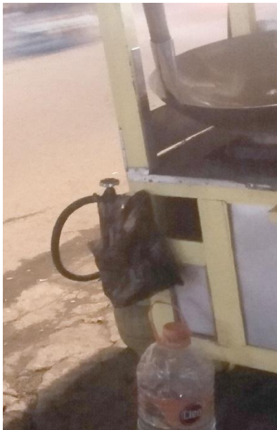
Gambar 7. Tempat Sampah pada Nasi Goreng Abadi