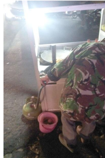
Gambar 6. Penjamah Makanan Tidak Menggunakan Celemek dan Penutup Kepala pada Nasi Goreng Makmur