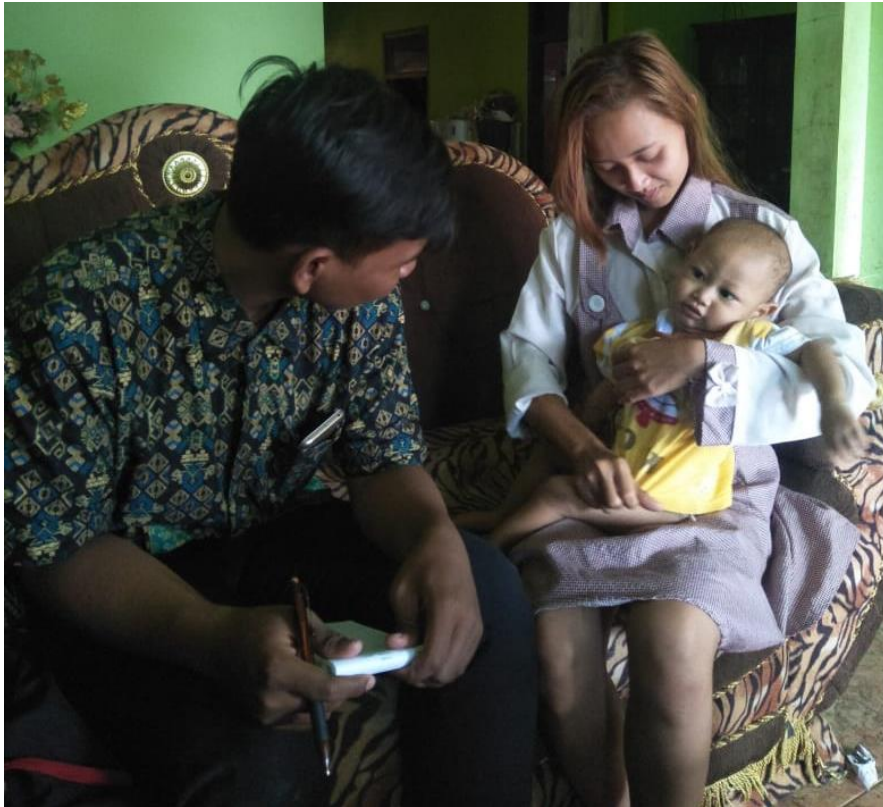
Proses pengambilan data recall responden