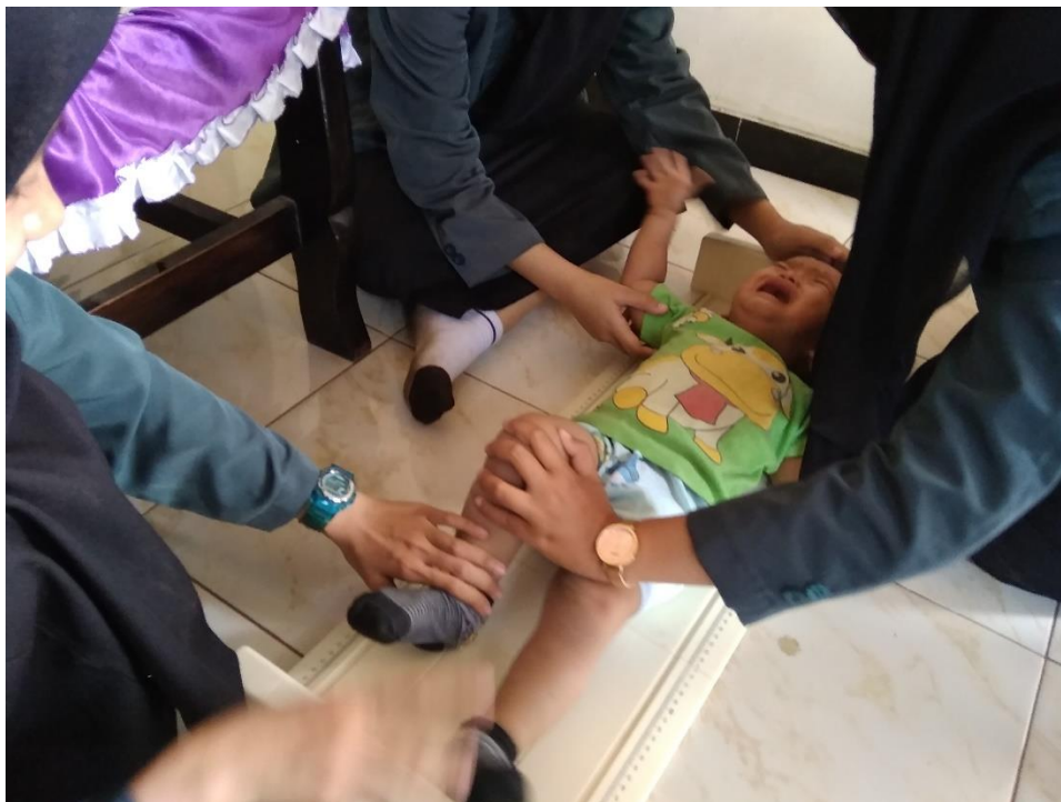
Pengukuran antropometri responden