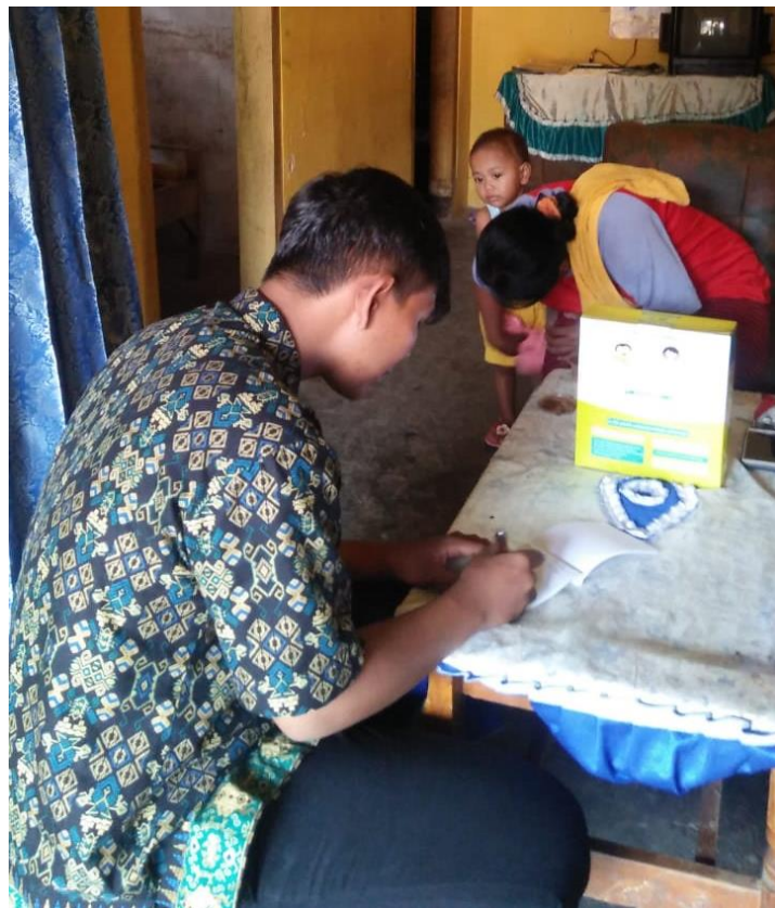
Proses pengambilan data recall responden