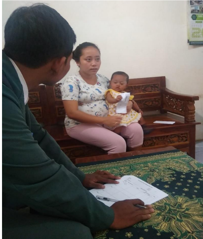
Proses pengambilan data recall responden