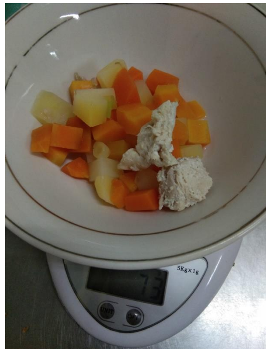
Penimbangan soup sehat 79 gram