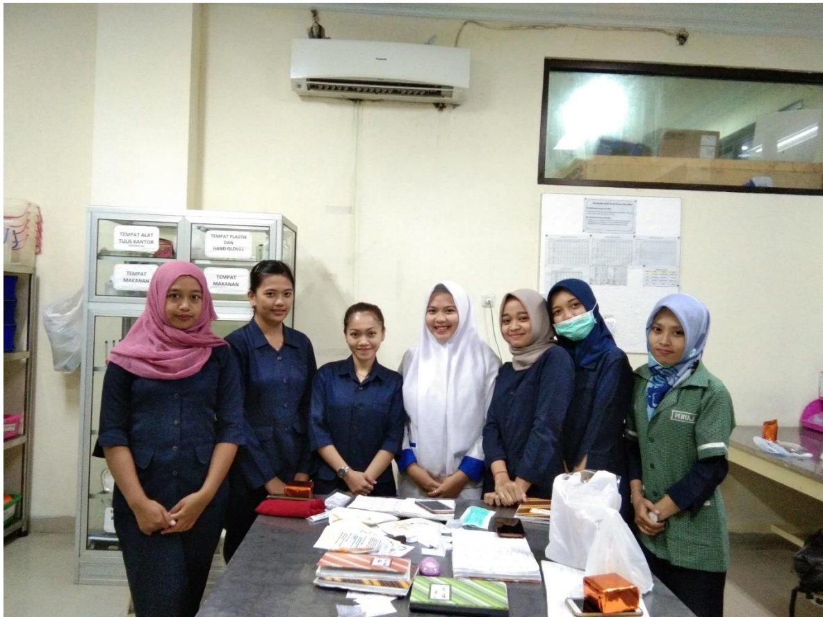
Foto bersama dengan karyawan gizi (pantry) RSUD Mardi waluyo Kota Blitar