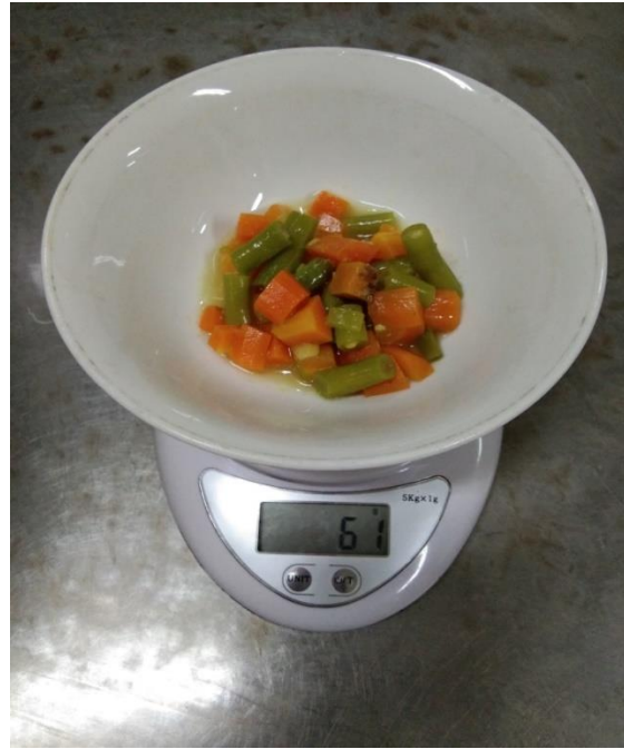
Penimbangan sayur (sayur buncis 87 gram, kare wortel buncis 61 gram)