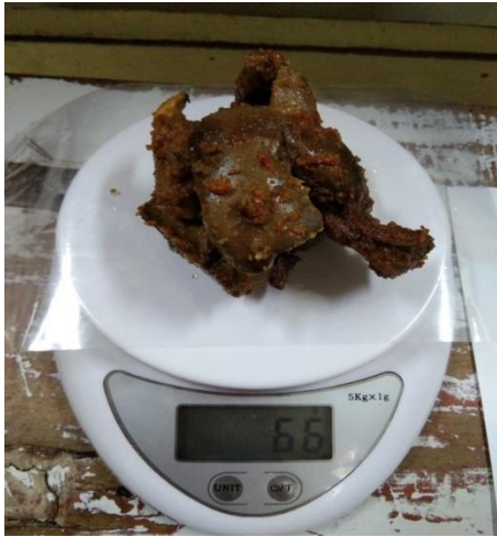
Penimbangan lauk hati ayam 66 gram