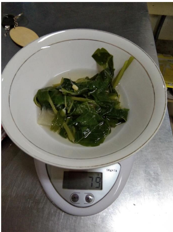
Penimbangan sayur menir 79 gram