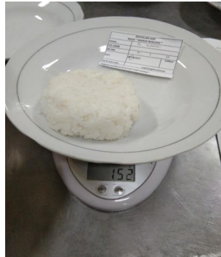
Penimbangan Nasi Tim (152 gram)