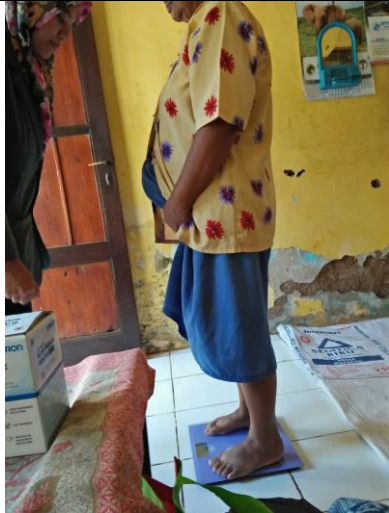
Pengukuran berat badan pasien hipertensi rawat jalan