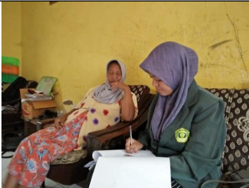
Wawancara makanan dalam sehari, aktivitas fisik dalam satu minggu, dan menjelaskan pengisian kuesioner food record pasien hipertensi rawat jalan