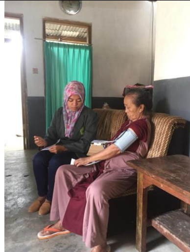
Pengukuran tekanan darah pasien hipertensi rawat jalan