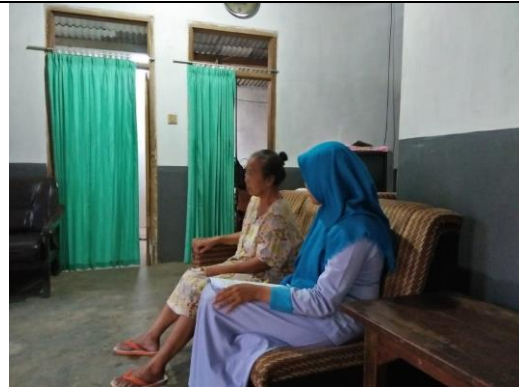
Wawancara makanan dalam sehari, aktivitas fisik dalam satu minggu, dan menjelaskan pengisian kuesioner food record pasien hipertensi rawat jalan