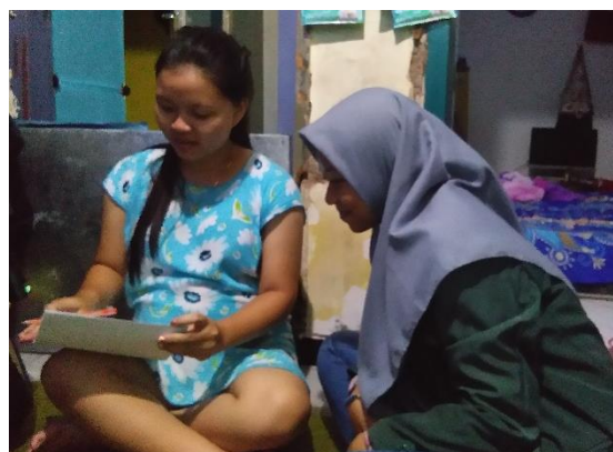
Gb 10 Responden Mengisi Soal Pre dan Post Test