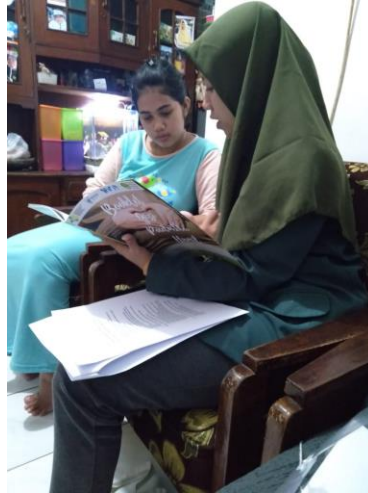
Gb 4 Konseling Gizi ke 1