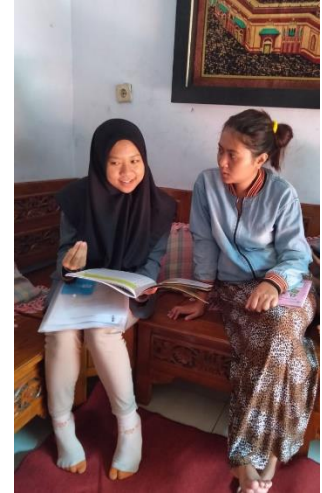
Gb 5 Konseling Gizi ke 2