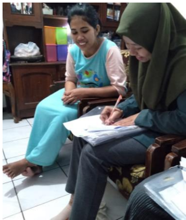
Gb 8 Mendata Makanan responden