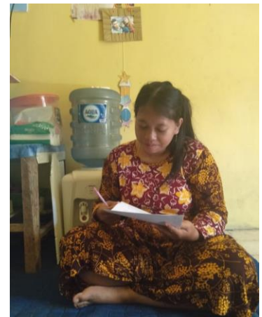
Gb 6 Responden Mengisi Soal Pre dan Post Test