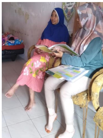
Gb 9 Proses Konseling Gizi dengan Media Booklet