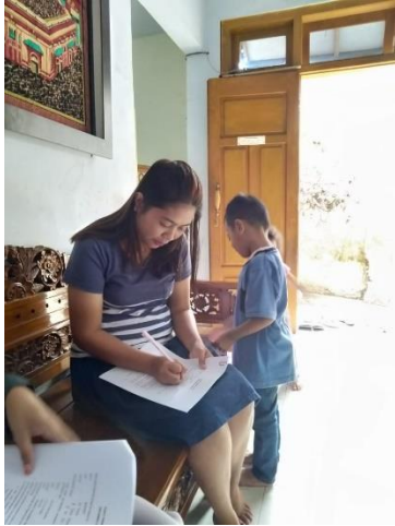
Gb 3 Sebelum Konseling Gizi