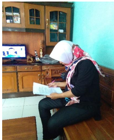
Gb 7 Responden Mengisi Soal Pre dan Post test