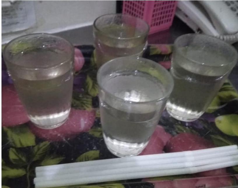
Gambar 5. Air gula