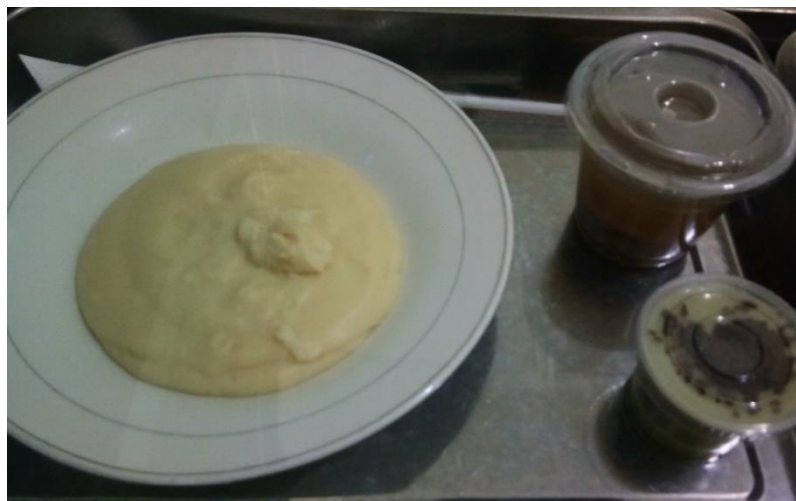
Gambar 3. Contoh menu dengan bubur halus