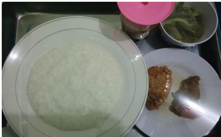
Gambar 2. Contoh menu dengan bubur kasar