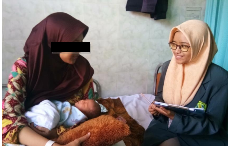
Gambar 1. Wawancara dengan responden