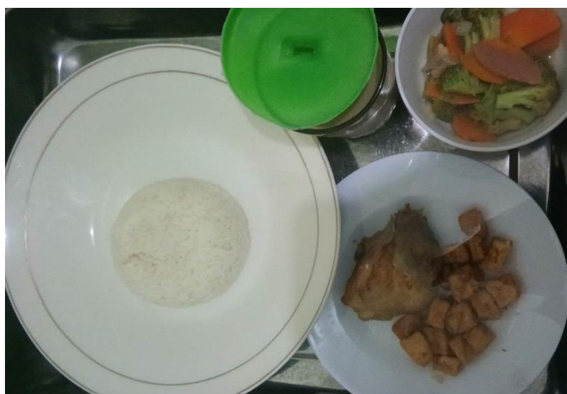
Gambar 4. Contoh menu dengan nasi