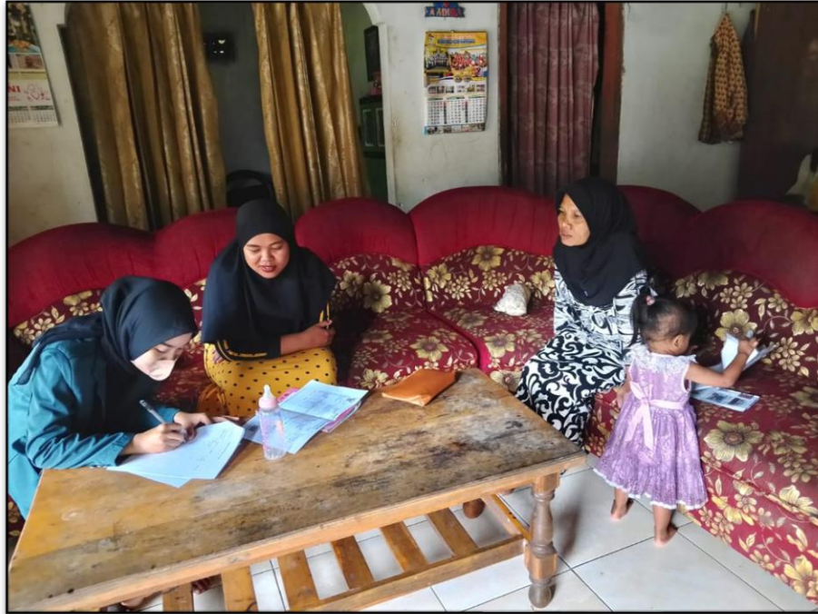
Gambar 2. Recall Ibu Balita Gizi Kurang