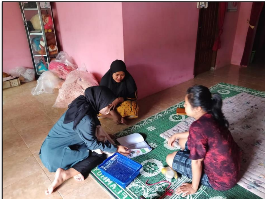
Gambar 3. Recall Ibu Balita Gizi Baik