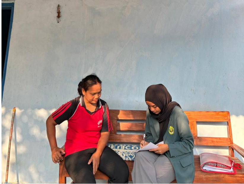
Gambar 4. Recall Ibu Balita Gizi Baik