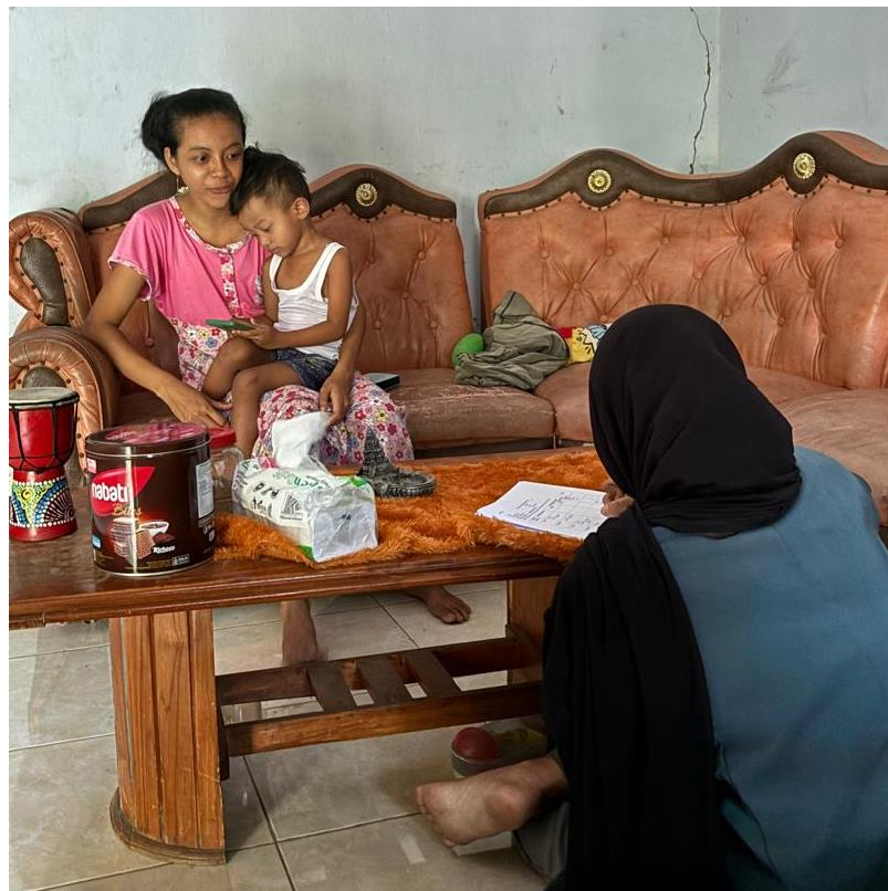
Gambar 3. Recall Ibu Balita Gizi Kurang