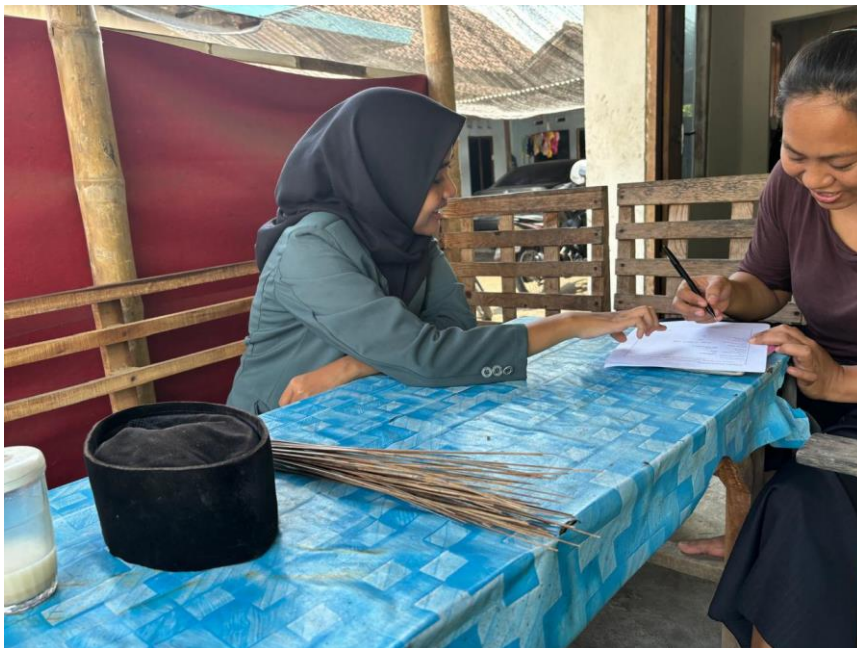
Gambar 5. Recall Ibu Balita Gizi Baik