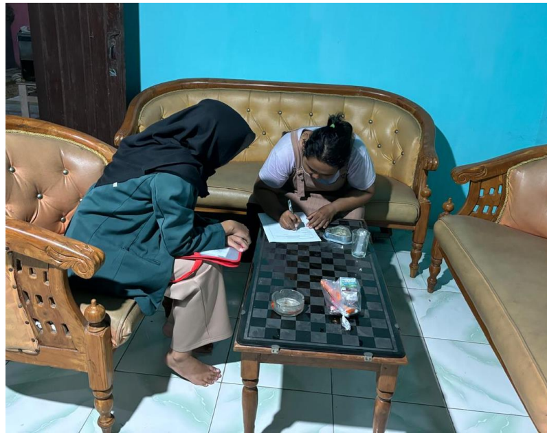
Gambar 2. Recall Ibu Balita Gizi Kurang