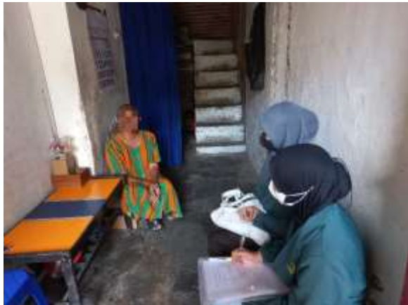
Wawancara dengan Ny. SA