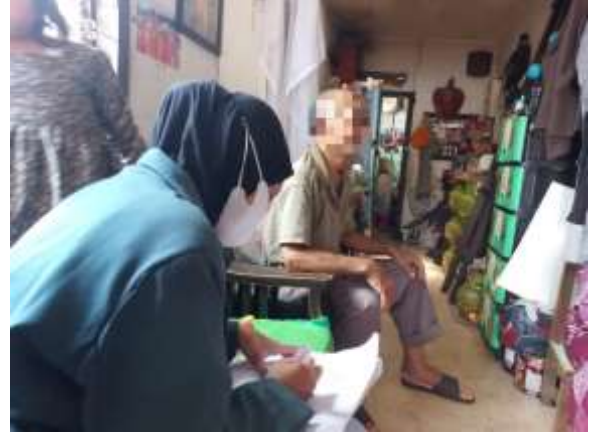
Wawancara dengan Ny. SA