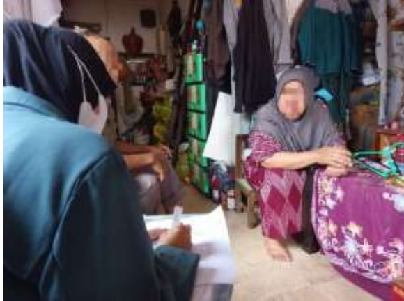
Wawancara dengan Tn. S