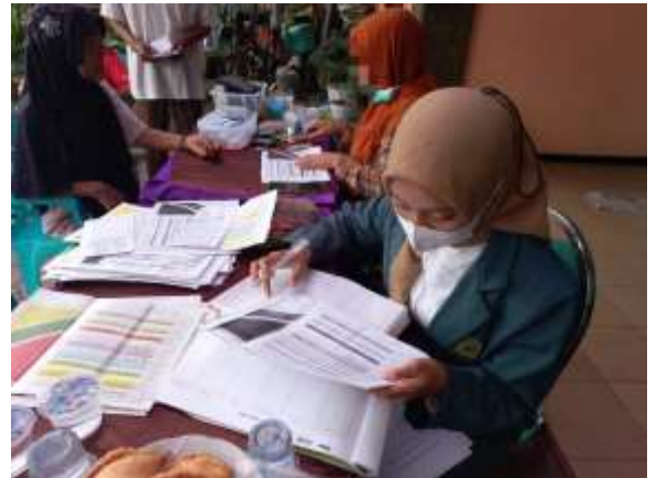
Wawancara dengan responden pada saat kegiatan posyandu lansia