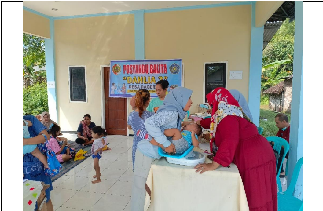
Penimbangan Berat Badan Balita