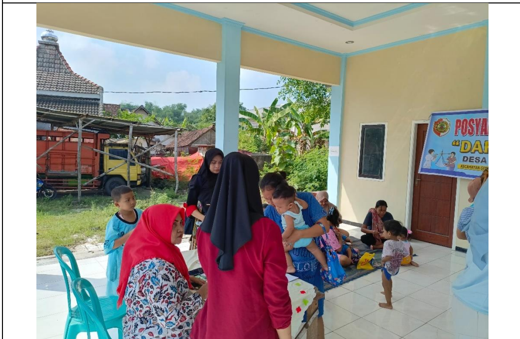
Pendaftaran dan Pengisian Daftar Hadir Posyandu