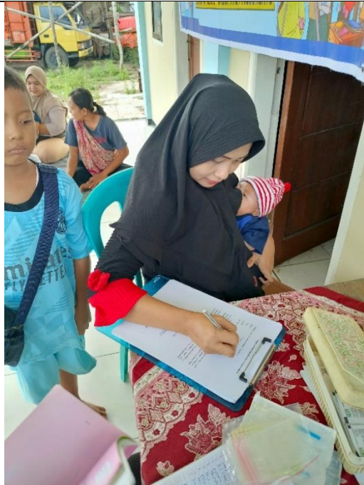
Pengisian Form Ketersediaan Menjadi Responden