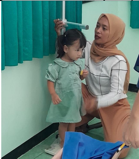
Pengukuran Tinggi Badan Balita