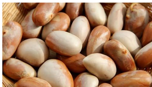
Gambar 2. 4 Biji Nangka

Biji Nangka terdiri dari tiga lapis kulit, yakni kulit luar berwarna kuning agak lunak, kulit liat berwarna putih dan kulit ari berwarna coklat yang menutupi biji nangka. Lapisan tipis coklat tersebut dinamakan spermoderm. “Spermoderm menutupi kotiledon yang berwarna putih. Kotiledon ini mengandung amilum yang tinggi” (Mukprasirt dan Sajjaanantakul, 2004).