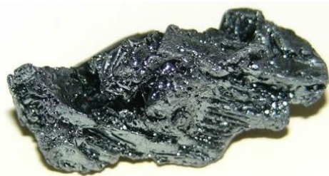
Gambar 2. 5 Padatan Iodin

Iodin atau Iodium (bahasa Yunani: Iodes - ungu), adalah unsur kimia pada tabel periodik yang memiliki simbol I dan nomor atom 53. Iodin ditemukan pada tahun 1811 oleh Courtois. Iodin merupakan sebuah anion monovalen. Iodin adalah halogen yang reaktivitasnya paling rendah dan paling bersifat elektropositif. Iodin adalah suatu unsur bukan logam yang termasuk golongan halogenida. Iodin terutama digunakan dalam medis, fotografi, dan sebagai pewarna. Seperti halnya semua unsur halogen lain, iodine ditemukan dalam bentuk molekul diatomik. Iodin merupakan padatan kristalin abu tua dengan uap ungu dengan titik leleh sebesar 114^{\circ}C . Iodin sedikit larut dalam air tetapi larut dengan sangat leluasa dalam pelarut organik.