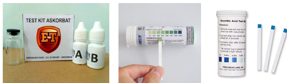
Gambar 2. 3 Test Kit Komersial

Test kit vitamin C adalah suatu metode pengujian kualitatif secara sederhana untuk mengidentifikasi ada atau tidaknya kandungan vitamin dalam suatu sampel. Test kit vitamin C terdiri dari reagen – reagen yang dapat bereaksi dengan vitamin C sehingga menghasilkan perubahan warna apabila sampel positif mengandung vitamin C. Pada saat ini masih sedikit perusahaan yang memproduksi test kit vitamin C. Salah satu bentuk test kit vitamin C yang terdapat di pasaran seperti pada gambar: