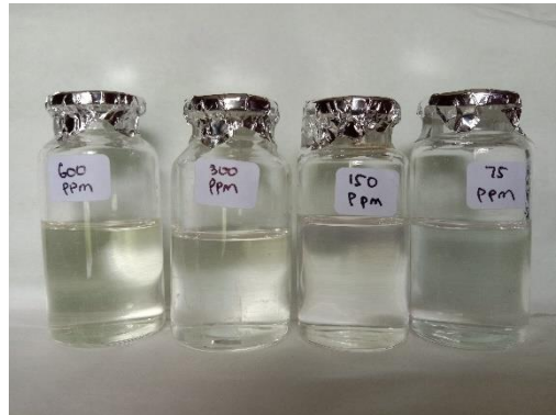
Gambar 4.10 Larutan Standar Asam Galat