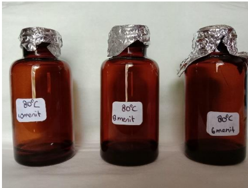
Gambar 4.13 Seduhan Teh Hijau Suhu 80°C dalam botol coklat yang dianalisis