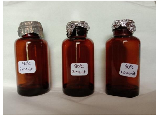
Gambar 4.14 Seduhan Teh Hijau Suhu 90°C dalam botol coklat yang dianalisis