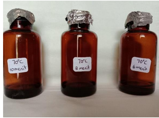
Gambar 4.12 Seduhan Teh Hijau Suhu 70°C dalam botol coklat yang dianalisis