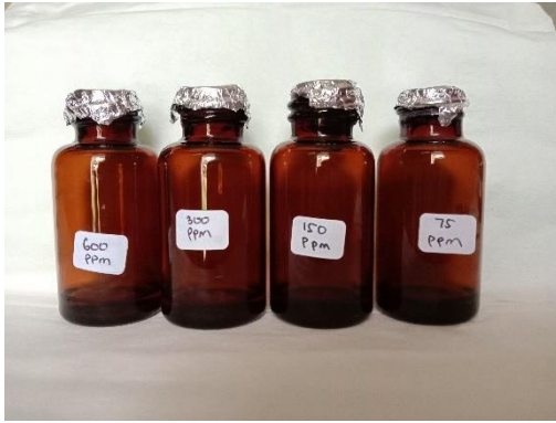
Gambar 4.11 Larutan Standar Asam Galat dalam botol coklat yang dianalisis