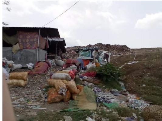
Gambar 2.1 TPA Mrican (dokumentasi peneliti)

Menurut SNI 03-3241-1994, Tempat pembuangan akhir sampah adalah sarana fisik untuk berlangsungnya kegiatan pembuangan akhir sampah berupa tempat yang digunakan untuk mengkarantinakan sampah kota secara aman (Badan Standarisasi Nasional, 1994).