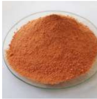
Gambar 1. Perasa Bubuk Balado

Bumbu bubuk didefinisikan sebagai bahan yang mengandung satu atau lebih jenis rempah yang ditambahkan ke dalam bahan makanan pada saat makanan tersebut diolah (sebelum disajikan) dengan tujuan untuk memperbaiki aroma, citarasa, tekstur, dan penampakan secara keseluruhan. Setiap komponen bumbu menyumbangkan citarasa, warna, aroma, dan penampakannya yang khas, sehingga kombinasinya satu sama lain akan memberikan sensasi baru yang dapat meningkatkan selera, daya terima, dan identitas tersendiri kepada setiap produk yang dihasilkan. Secara alami rempah-rempah mengandung berbagai macam komponen aktif yang sangat besar perannya dalam penciptaan rasa suatu produk. Rempah-rempah mengandung zat antioksidan, anti bakteri, antikapang, anti khamir, antiseptic, antikanker, dan antibiotik yang kesemuanya itu sangat besar perannya, membuat bumbu menjadi awet (Astawan, 2009).