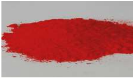
Gambar 2. Serbuk Rhodhamin B

Rhodamin B adalah zat warna sintesis berbentuk serbuk kristal, berwarna hijau atau ungu kemerahan, tidak berbau, dan dalam larutan berwarna merah terang berfluorensi. Rhodamin B semula digunakan untuk kegiatan histologi dan sekarang berkembang untuk berbagai keperluan seperti sebagai pewarna kertas dan tekstil. Rhodamin B sering disalah gunakan untuk pewarna pangan dan pewarna kosmetik, misalnya sirup, saus, lipstik, pemerah pipi, dan lain-lain. Pewarna ini terbuat dari dietillaminophenol dan phatalic anhidria dimana kedua bahan baku ini sangat toksik bagi manusia. Biasanya pewarna ini digunakan untuk pewarna kertas, wol dan sutra (Sugiharti, 2004).