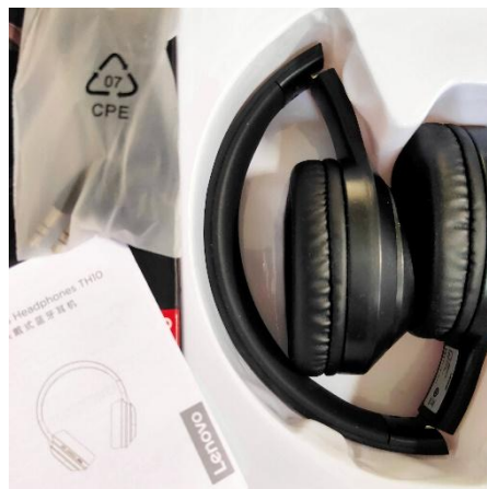
Gambar 3. 2 Headphone Lenovo TH10 Bluetooth Wireless

Untuk mendukung observasi peneliti menggunakan Headphone yang dihubungkan melalui Music Player dari smartphone yang berisi musik instrumental jawa. Headphone yang digunakan yaitu headphone Lenovo TH10 Bluetooth Wireless dengan keunggulan: Dapat merasakan suara HIFI, 3D dengan dual power loudspeakers dan CVC microphones ; Audio AUX yang kompatibel dengan banyak perangkat android atau ios; Nyaman dipakai lama, dengan masa pakai baterai yang kuat ( 12 hours of playback ).