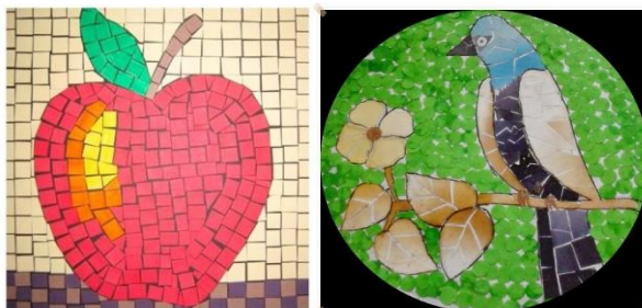
Gambar 2.1 Permainan Mozaik.