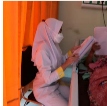
Ket : selasa, 20 feb 2024 pengambilan data Bersama Ny. S di ruang 1