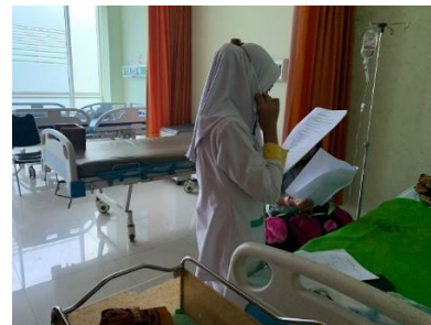
Ket : rabu, 13 maret 2024 pengambilan data Bersama Ny. R di ruang 2