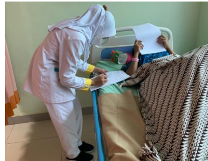
Ket : senin, 4 maret 2024 pengambilan data Bersama Ny. A di ruang RG1