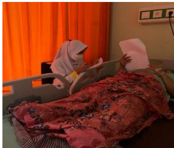
Ket : jumat, 8 maret 2024 pengambilan data Bersama Ny. S di ruang RG3