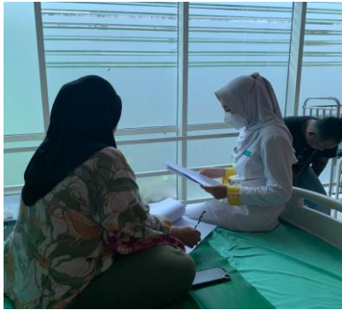
Ket : sabtu 17 feb 2024 pengambilan data Bersama Ny. A di ruang RG1