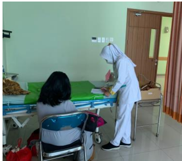
Ket : kamis, 22 feb 2024 pengambilan data Bersama Ny. R di ruang RG3