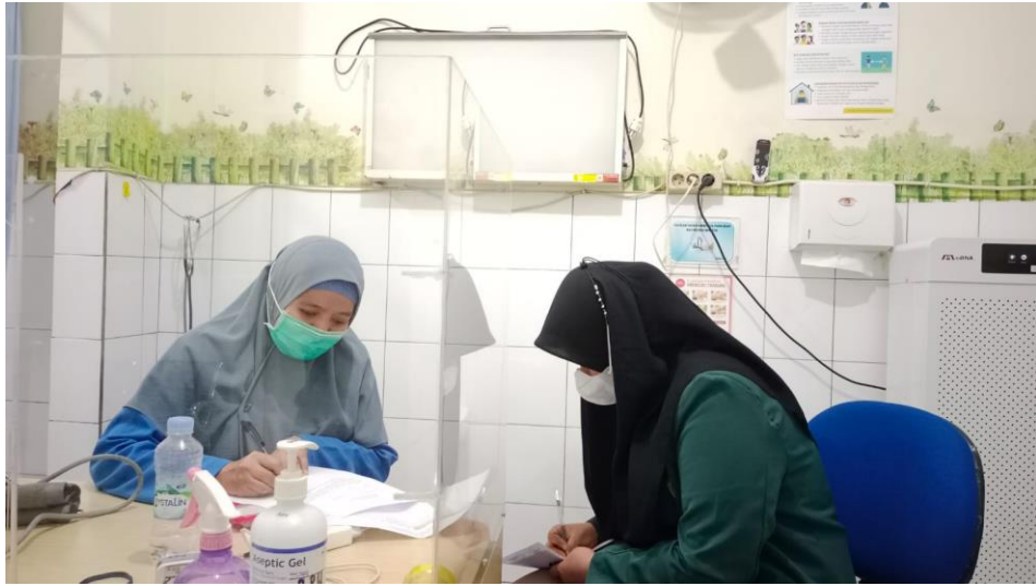
Lampiran 12 Foto dokumentasi penelitian