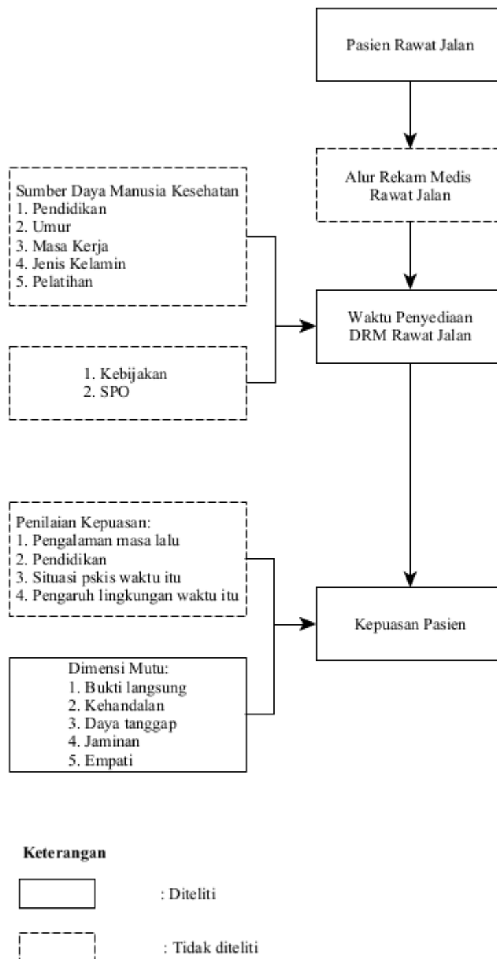
Gambar 2. 1 Kerangka Teori

Sumber: (Valentina, 2020); (Sudrajat & Sugiarti, 2015); (Erlindai, 2019)