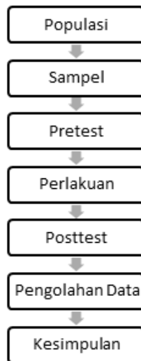
Gambar 1 Tahap Penelitian