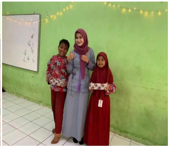
Observasi Tindakan CTPS Minggu-2