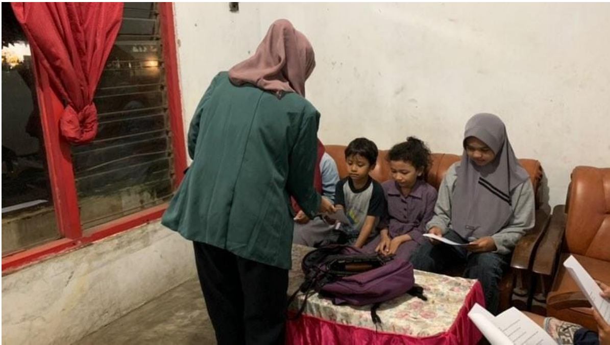
Pemberian Pretest dan Intervensi Minggu-1