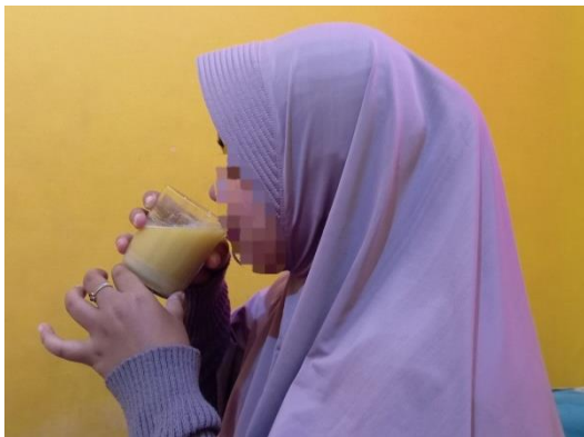
Dokumentasi Responden Mengonsumsi Produk PKMK DM