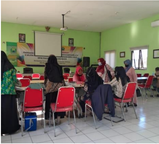
Dokumentasi Pemberian Produk Kepada Responden