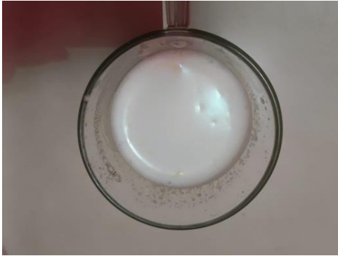
Produk Formula Komersial (Diabetasol)