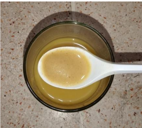
Produk Prototype PKMK DM