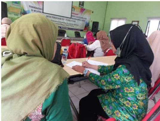
Dokumentasi Pengambilan Data Kepada Responden