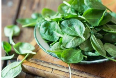
Gambar 5. Bayam (Muhlisin, 2019)

Bayam ( Amaranthus ) adalah tumbuhan yang biasa ditanam untuk dikonsumsi daunnya sebagai sayuran hijau. Tumbuhan ini berasal dari Amerika tropik namun sekarang tersebar ke seluruh dunia. Di Indonesia bayam banyak tumbuh di berbagai tempat. Selain dalam penanamannya yang mudah, pengolahan bayam juga mudah dilakukan. Sehingga, banyak masyarakat terutama masyarakat Indonesia menjadikan bayam sebagai salah satu bahan pangan yang sering dikonsumsi dan paling banyak diminati. Bayam dapat mencegah berbagai penyakit seperti mengurangi stres oksidatif, menjaga kesehatan mata karena kandungan Vitamin A didalamnya, mencegah kanker, mengatasi diabetes, menurunkan tekanan darah, mencegah asma, menjaga kesehatan tulang, dan mencegah anemia.