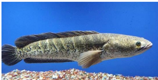
Gambar 2. Ikan Gabus (Aprilia, 2023)

Ikan gabus merupakan air tawar yang dapat ditemukan di seluruh perairan Indonesia. Ikan gabus telah diasosiasikan sebagai obat, karena kandungan yang dimilikinya telah terbukti secara klinis pada beberapa penyakit. Secara klinis, intervensi konsentrat protein ikan gabus dalam bentuk suplemen telah membantu mempercepat penyembuhan pasien pasca operasi, luka bakar dan stroke pada pasien rawat inap di rumah sakit (Soniya & Fauziah, 2020). Ikan gabus diolah menjadi berbagai jenis masakan lalu disajikan kepada keluarga yang sakit, terutama bagi yang pasca operasi. Sebenarnya pemahaman masyarakat tentang ikan gabus sebagai obat telah dikenal sejak nenek moyang kita dahulu terutama di beberapa daerah di Sulawesi Selatan seperti Wajo, Pinrang dan Takalar walaupun saat itu mereka tidak mengetahui kandungan yang terdapat dalam ikan.