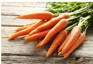
Gambar 4. Wortel (Afifah, 2020)

Wortel ( Daucus carota L ) termasuk jenis tanaman sayuran umbi semusim, berbentuk semak (perdu) yang tumbuh tegak dengan ketinggian antara 30 cm-100 cm atau lebih, tergantung jenis varietasnya. Wortel merupakan sayuran umbi semusim berbentuk rumput. Wortel memiliki batang pendek yang hampir tidak tampak. Akar berupa akar tunggang yang tumbuh membengkok, membesar, dan memanjang meyerupai umbi, umbi