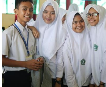
Gambar 1. Remaja (UNICEF, 2019)

Masa remaja merupakan masa peralihan dari kehidupan kanak-kanak menuju dewasa awal yang ditandai akan adanya perubahan secara biologis dan psikologis. Dalam hal ini remaja terjadi perubahan secara biologis meliputi perubahan fisik dan berkembangnya seks primer dan sekunder. Sedangkan pada perubahan psikologis meliputi adanya perubahan dalam hal emosi yang berubah dan merasa lebih sensitif (K. B. Hidayati, 2016). Menurut Almaratus & Muniroh (2019), Remaja adalah seseorang yang baru menginjakkan dan mengenal mana yang baik dan buruk, mengenal lawan jenis dan memahami tugas dan peranan dalam lingkungan sosial (Almaratus & Muniroh, 2019). Berdasarkan uraian tersebut, dapat dijabarkan bahwa masa remaja merupakan masa tansisi perubahan secara fisik dan mental sehingga dapat merubah kondisi emosionalnya.