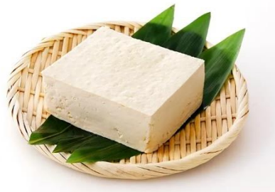
Gambar 3. Tahu (Fadli, 2022)

Tahu merupakan salah satu produk olahan kedelai sebagai pangan fungsional yang mengandung protein, lemak, karbohidrat dan serat. Dibuat melalui proses penggumpalan protein sehingga berbentuk semi padat. Tahu dikenal sebagai produk pangan yang tidak awet dan proses pembuatannya umumnya dilakukan secara konvensional atau tradisional dari segi peralatan, metode dan pemasarannya. Penyebab tahu mudah rusak yaitu kadar air dan protein yang tinggi, masing-masing 86% dan 8-12%, sedangkan kadar lemak 4,8% dan karbohidrat 1,6%. Kondisi ini mudah mengundang timbulnya jasad renik pembusuk, terutama bakteri. Tahu juga mengandung mineral seperti kalsium, zat besi, fosfat, kalium, natrium, serta vitamin seperti kolin, vitamin B dan vitamin E.