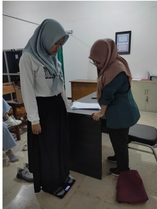
Pengukuran berat badan