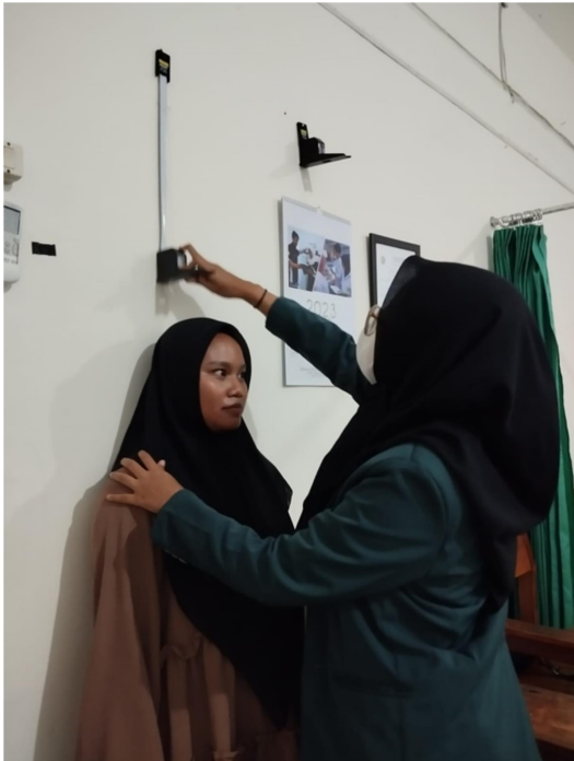
Pengukuran tinggi badan