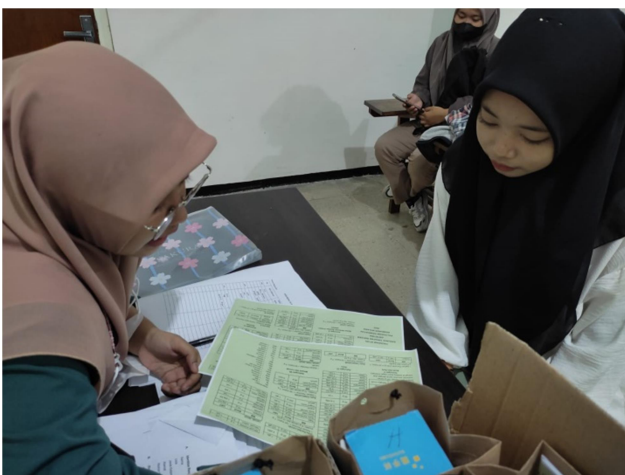
Kegiatan konseling gizi