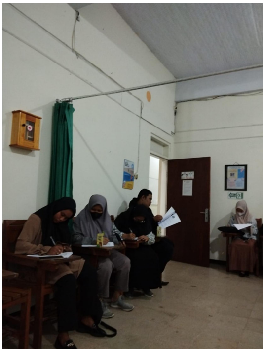
Pengisian persetujuan mengikuti kegiatan penelitian