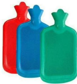
Gambar 2.3 WWZ ( Warm Water Zack )