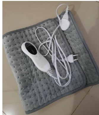
Gambar 2.2 Bantal Pemanas

Bantalan pemanas adalah bantal kain yang berisi gel silika yang dapat dipanaskan. Beberapa variasi dari teknik ini termasuk terapi dengan botol panas atau kompres listrik hangat. (Hakiki & Kushartanti, 2018).