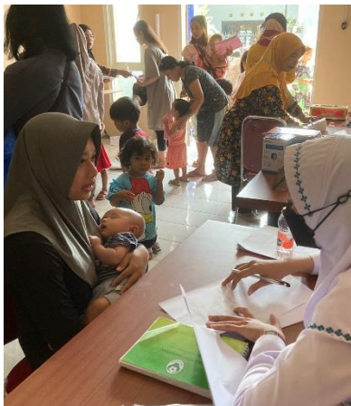
Wawancara konsumsi ASI bayi usia 0-6 bulan