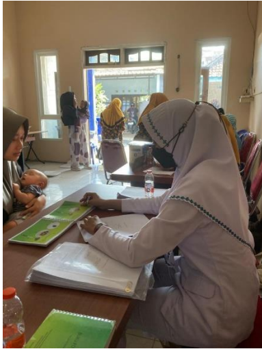
Wawancara food recall asupan vitamin B12 ibu menyusui