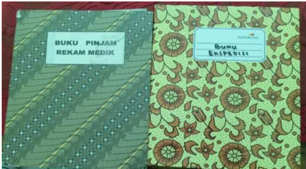
Lampiran 9 Gambar Tampilan Buku Ekspedisi Peminjaman dan Pengembalian Dokumen Rekam Medis Puskesmas Dinoyo