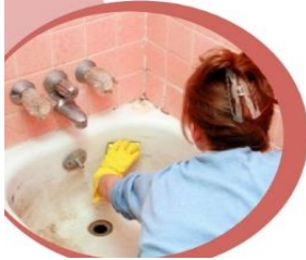
(Gambar 3. Menguras Bak Mandi)

- Menguras, merupakan kegiatan membersihkan/menguras tempat yang sering menjadi penampungan air seperti bak mandi, kendi, toren air, drum dan tempat penampungan air lainnya. Dinding bak maupun penampungan air juga harus digosok untuk membersihkan dan membuang telur nyamuk yang menempel erat pada dinding tersebut. Saat musim hujan maupun pancaroba, kegiatan ini harus dilakukan setiap hari untuk memutus siklus hidup nyamuk yang dapat bertahan di tempat kering selama 6 bulan. Menguras bak mandi efektif dilakukan setiap satu minggu sekali.