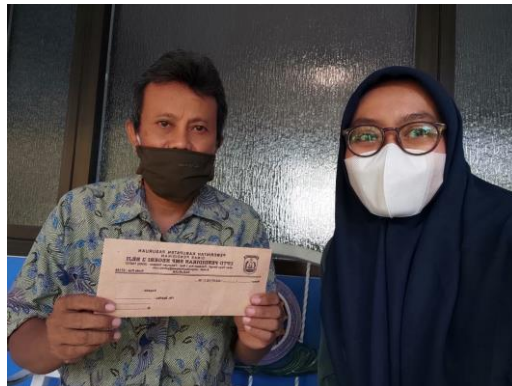
Dokumentasi Perizinan Penelitian