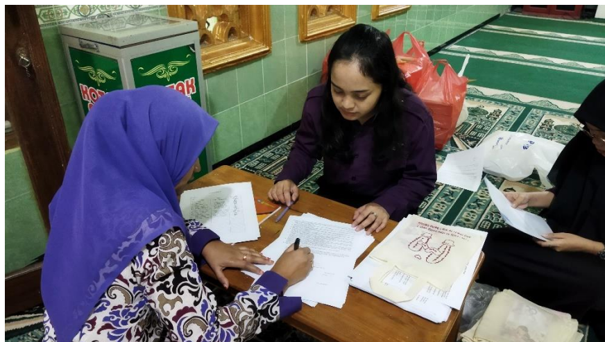
Lampiran 16 Foto Kegiatan