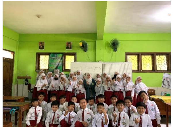
Kegiatan Intervensi Penelitian Bertempat di Kelas V SD NU Blimbing Kota Malang pada tanggal 25 Maret 2024