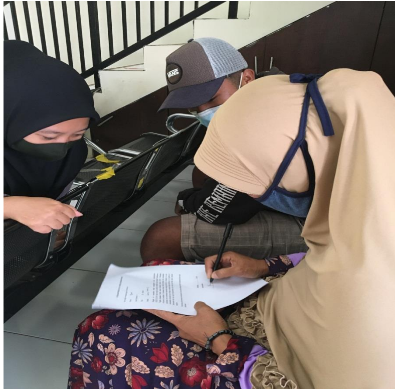
Lampiran 8 Kegiatan Penelitian