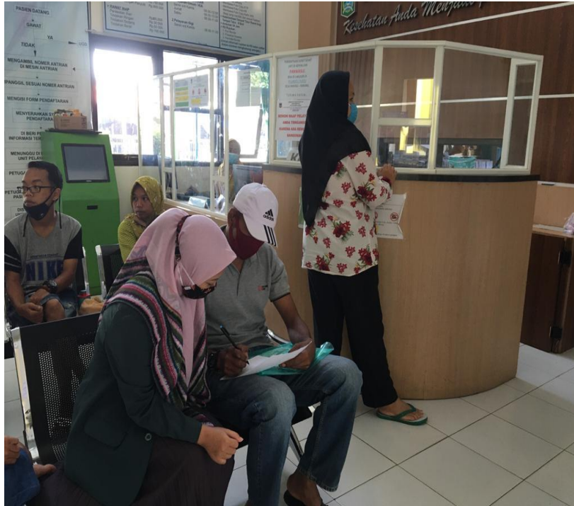
Lampiran 10 Kegiatan Penelitian