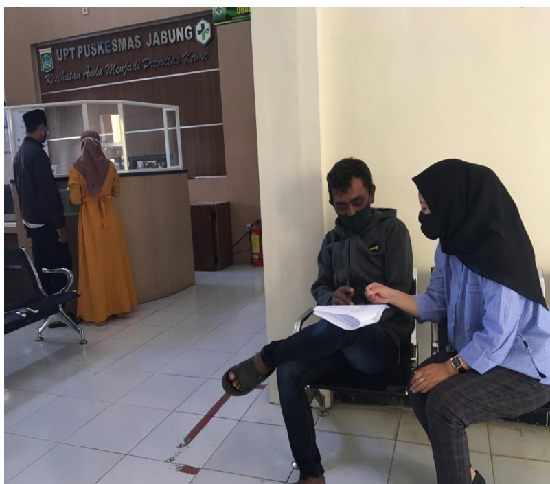
Lampiran 7 Kegiatan Penelitian