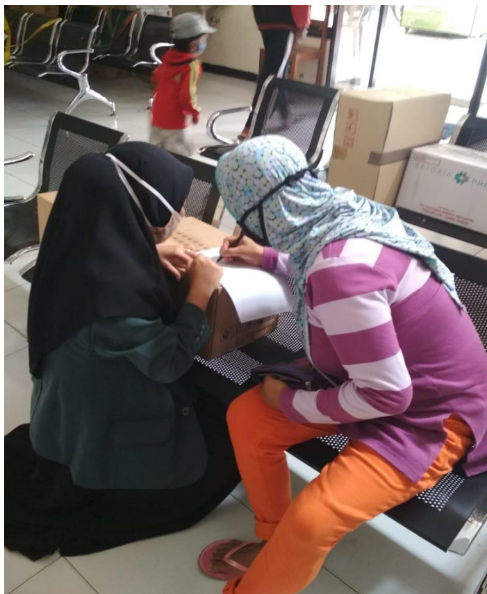
Lampiran 6 Kegiatan Penelitian