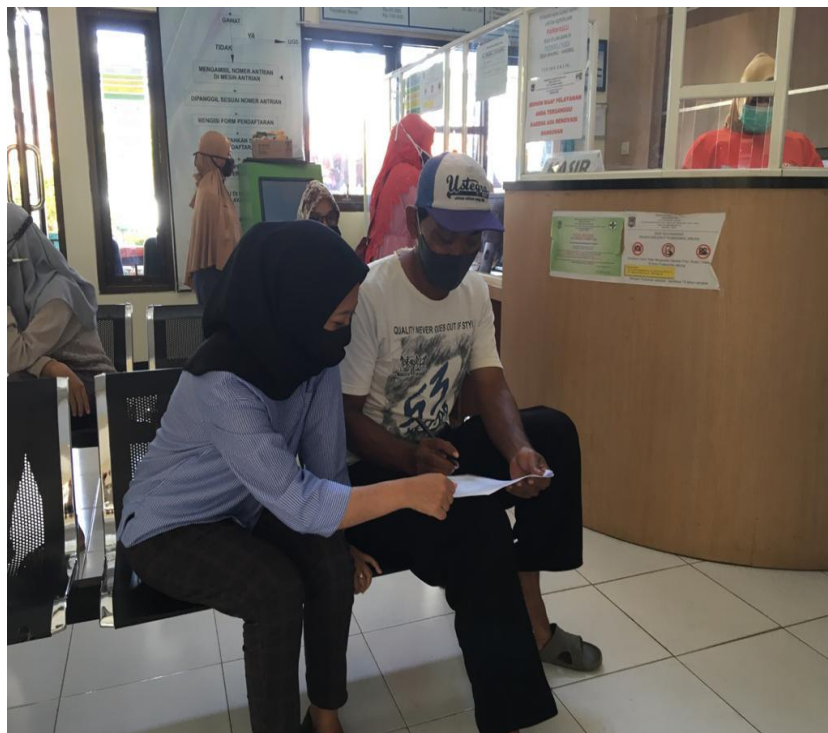
Lampiran 9 Kegiatan Penelitian